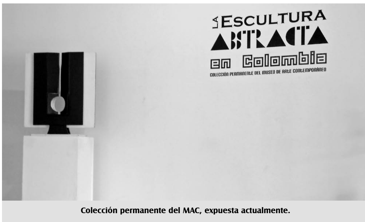
Colección permanente del MAC, expuesta actualmente.

actividades esenciales del hombre como alimentación, trabajo y vestido. Con el método de la globalización (M. E.N., El Doctor Decroly en Colombia , Bogotá, 1932, pp. 145-150), el método Decroly en 1936 se adoptó oficialmente, después con la venida de la alemana Francisca Radke, y se impulsó en el Instituto Pedagógico Femenino un plan de estudios que incluía la enseñanza de la música clásica anexándose una escuela primaria para las prácticas de los docentes, igualmente se trae un piano, un aparato para diapositivas para enseñar historia del arte y aparatos para gimnasia, se acentuó la aritmética y las ciencias con adecuación de laboratorios, las nuevas maestras se formaron en el respeto a la cultura alemana y europea (M.E.N., Memorias de 1927 , p. VI), funcionó muchos años como internado, se consolidó como el único instituto que dio educación superior tanto intelectual como científica a las jóvenes colombianas.