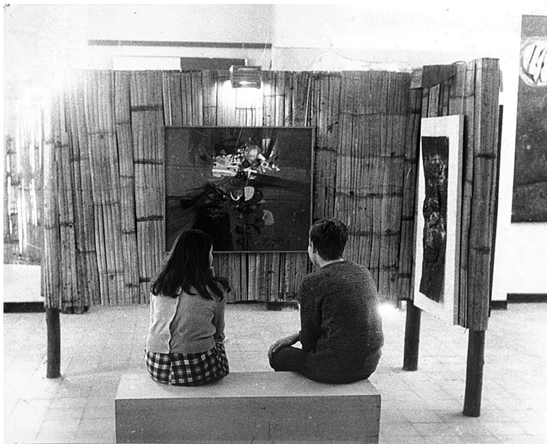
Ambiente de las salas del museo en su etapa inicial

En 1904 el programa fijado en el Decreto 491 de ese año era de bachillerato clásico que incluía: lengua española, latín, francés e inglés, aritmética, contabilidad, álgebra elemental, geometría plana, física experimental, geografía e historia del mundo y de Colombia, cosmografía elemental, retórica, religión y filosofía, la ley estaba orientada a respetar la libertad de enseñanza y en 1905 los colegios debían someter su plan de estudios y sus textos escolares a la autorización del ministerio.