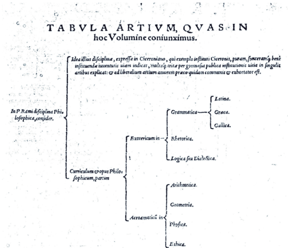
Figura 2. La Ramée, Pierre de (1512-1572). Auteur du texto Professio regia, hoc est septem artes liberales in regia cathedra, per ipsum Parisiis aprodictico docendi genere propositae, et per Joan Thomam Freigium... editae, 1576.

Fuente: gallica.bnf.fr / Bibliothèque nationale de France.