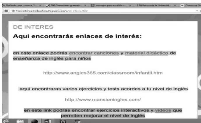
FIGURA 3. Material didáctico disponible