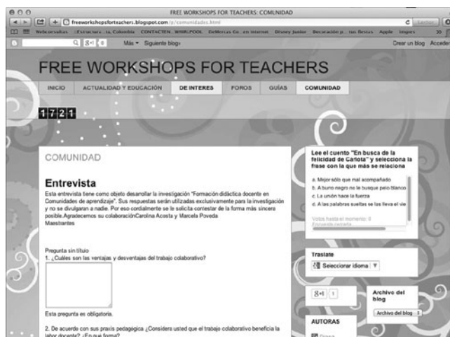
FIGURA 2. Cuestionario base de la entrevista