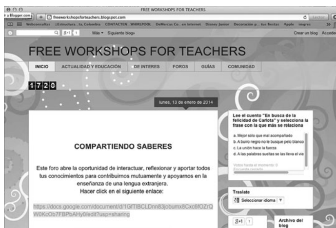
FIGURA 4. Foro virtual: Compartiendo saberes