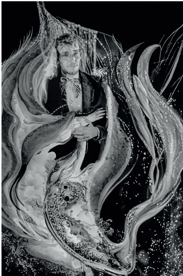
Chapi. Cero cero sirena.