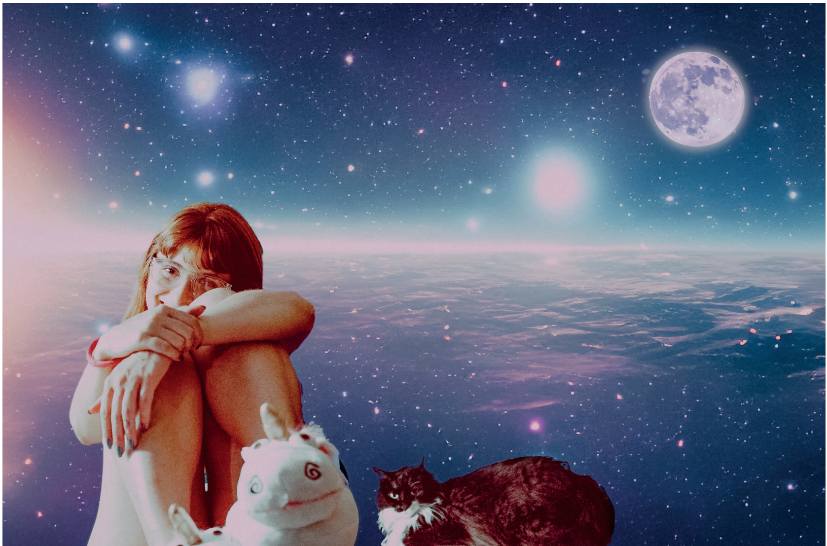
Max y albóndiga. Planeta Disney.