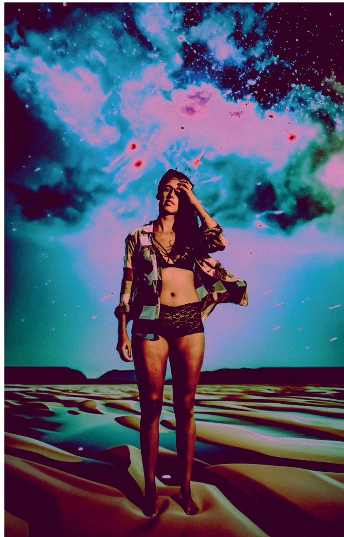
Mica se va de viaje.