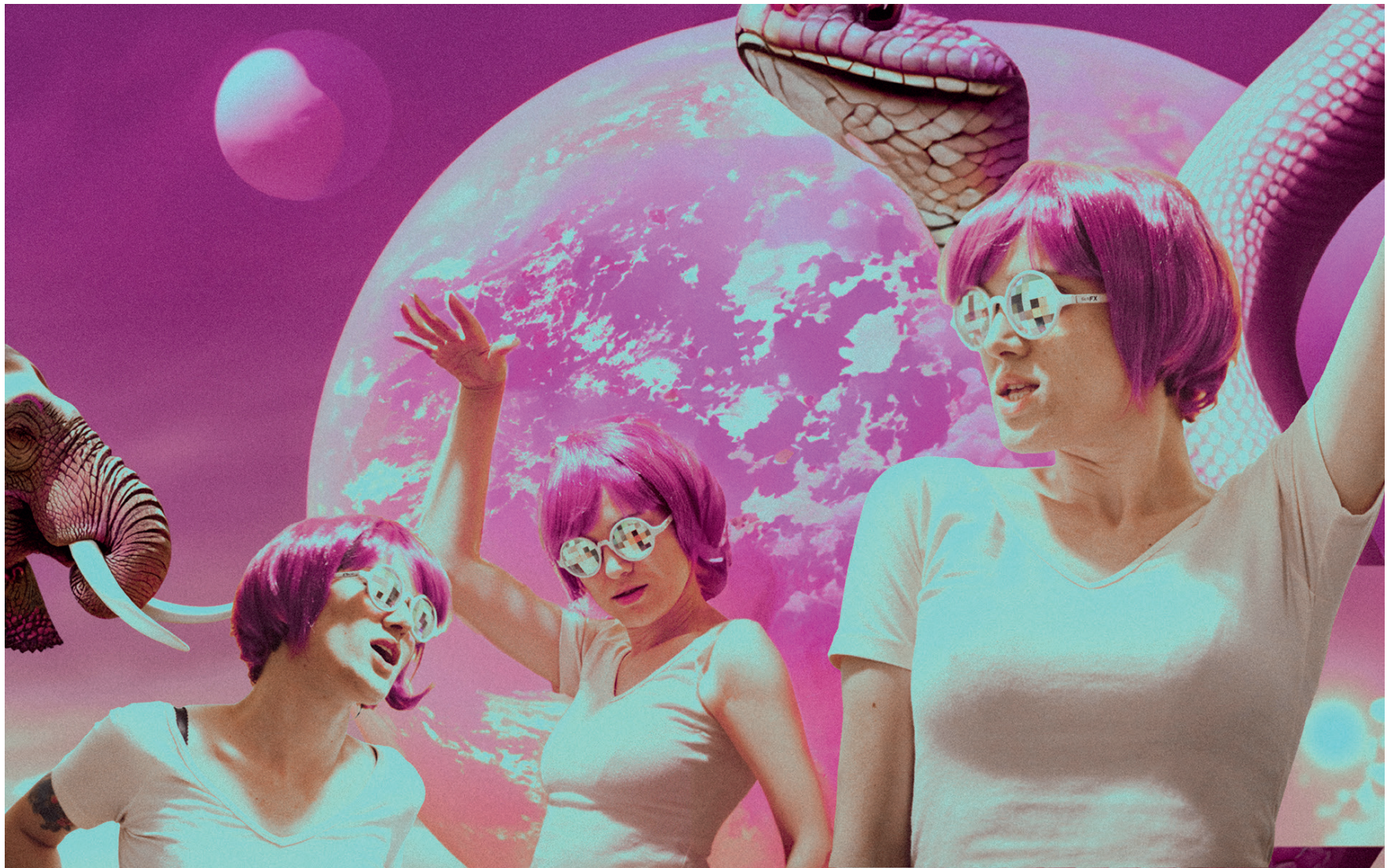
Anito. Planeta rosa.