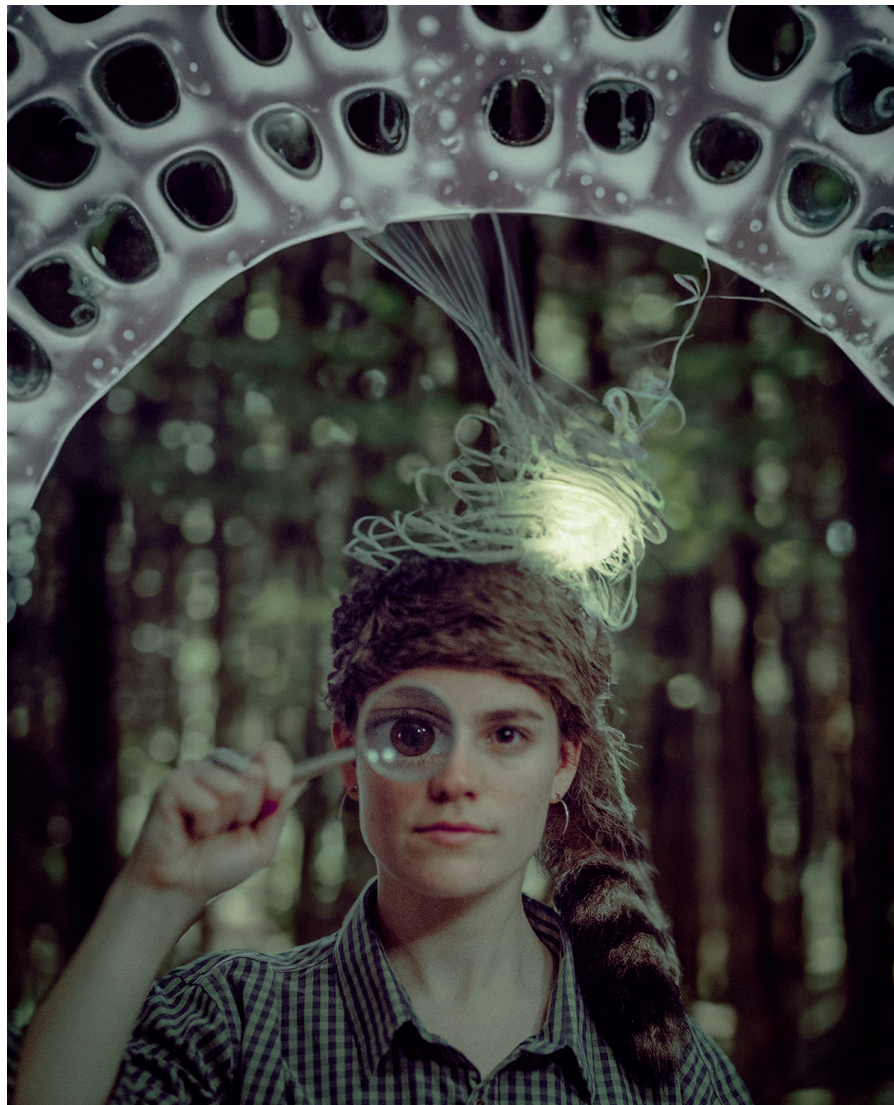
Celes. Planeta casa fantasma.