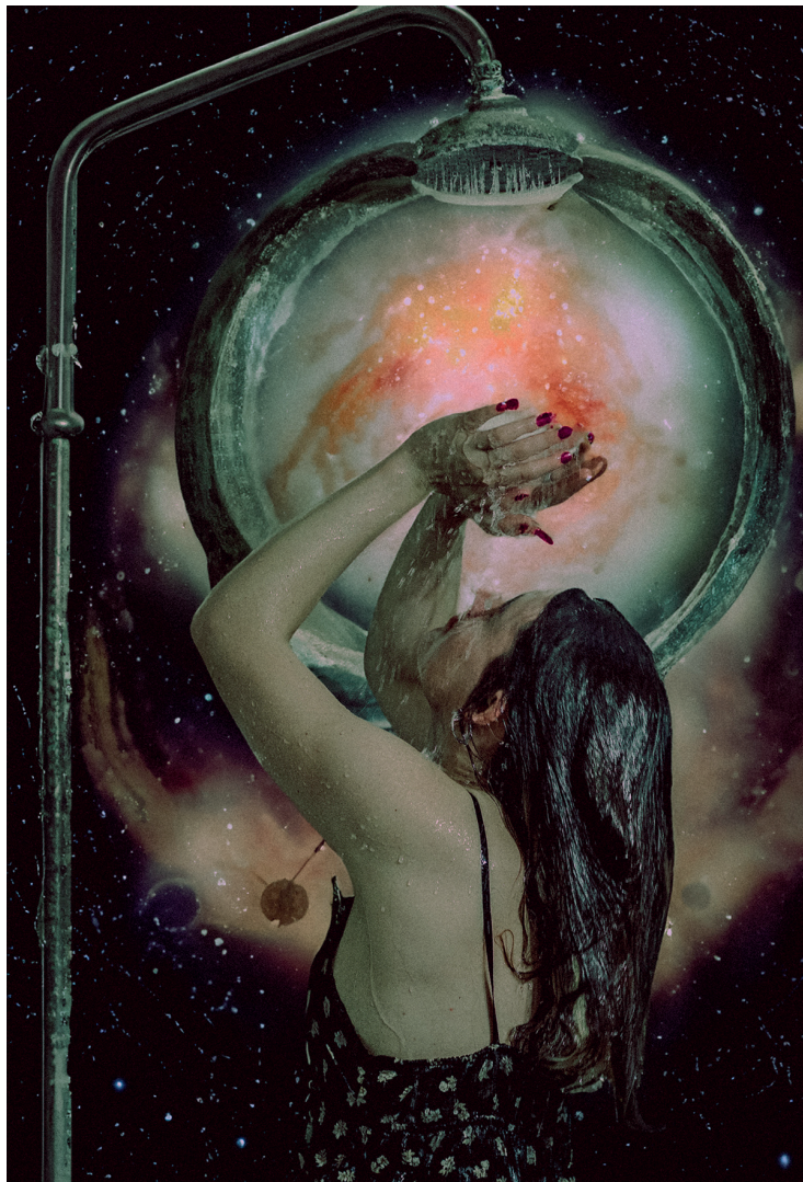
Celes. Planeta casa fantasma II.