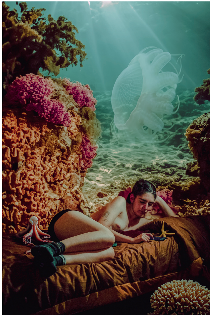
Luli. Lugar en el mundo.