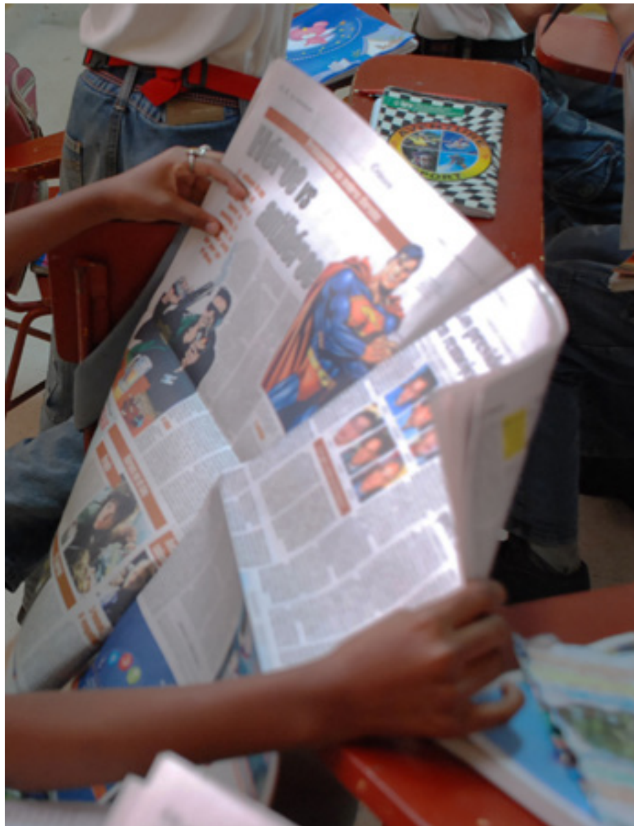
Barranquilla, 2007