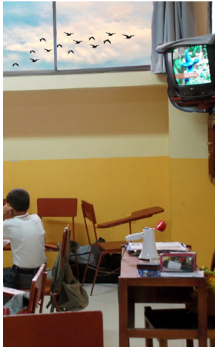
Barranquilla, 2007