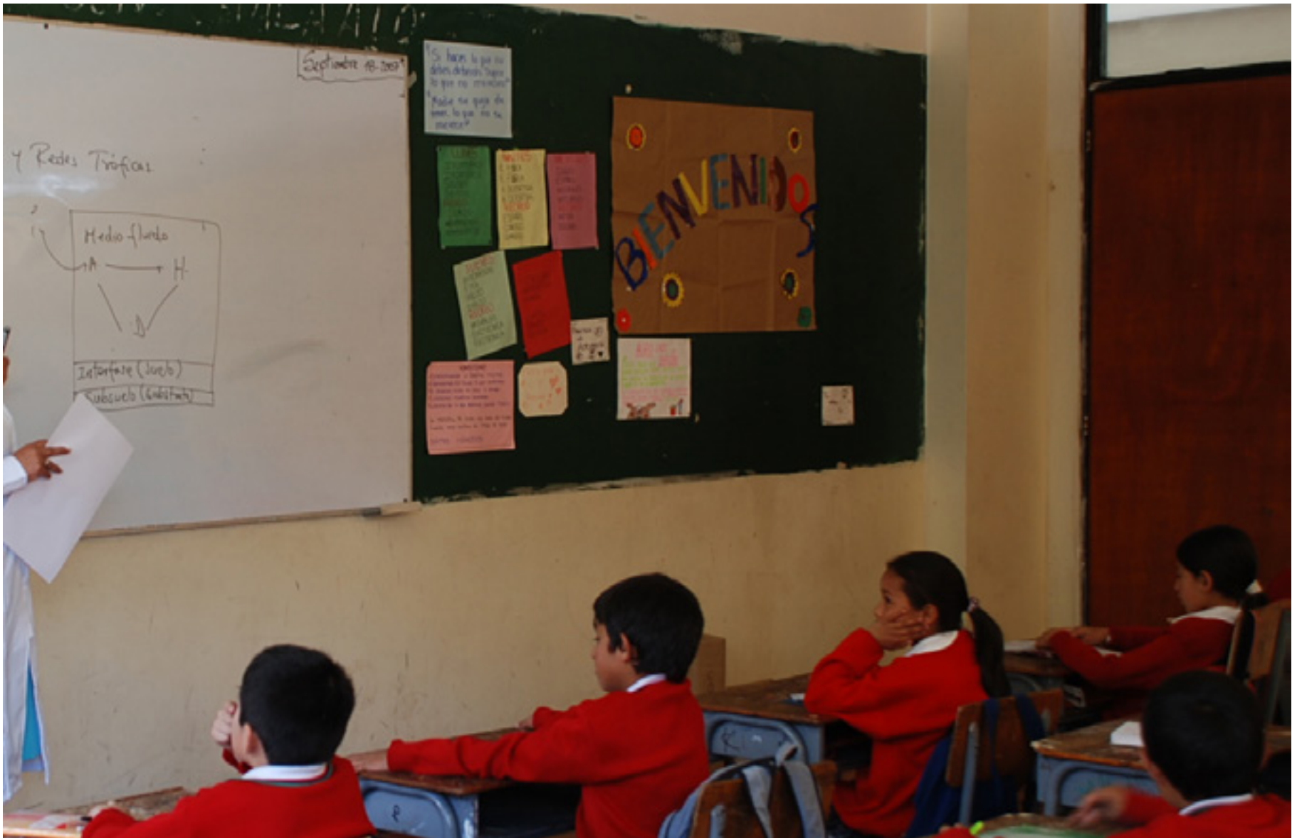
Duitama, 2007