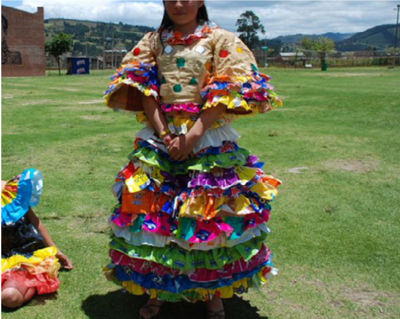
Duitama, 2007