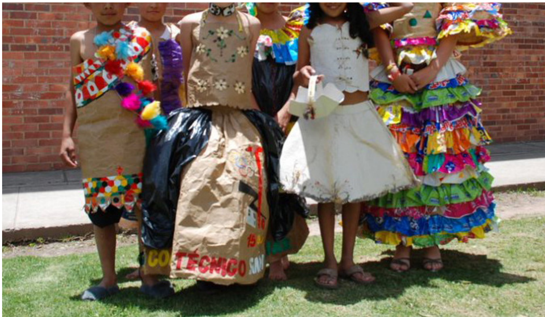
Duitama, 2007