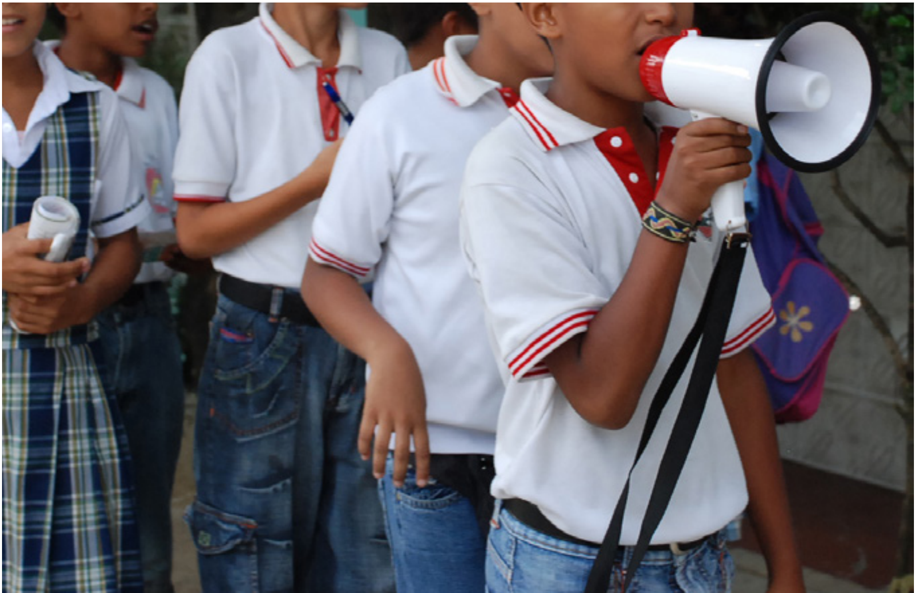
Barranquilla, 2007