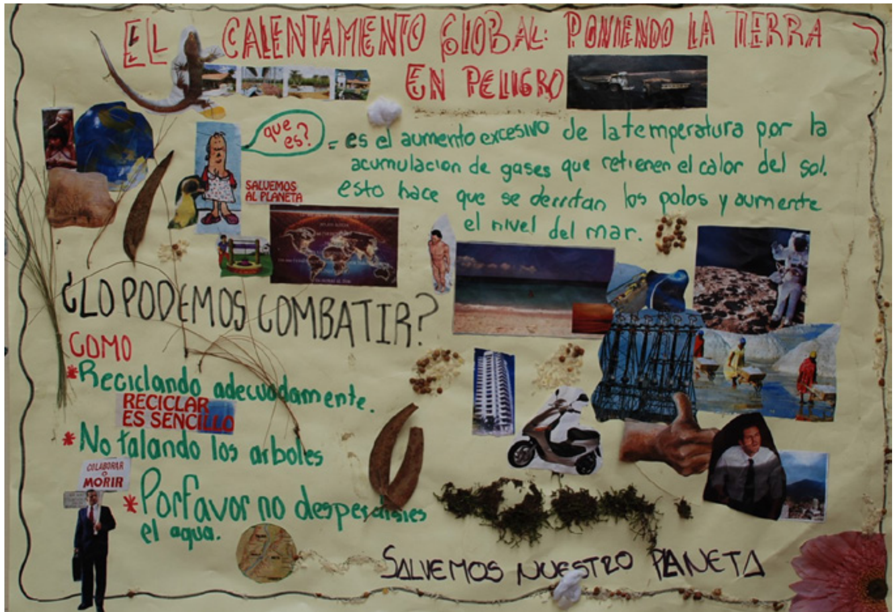
Duitama, 2007