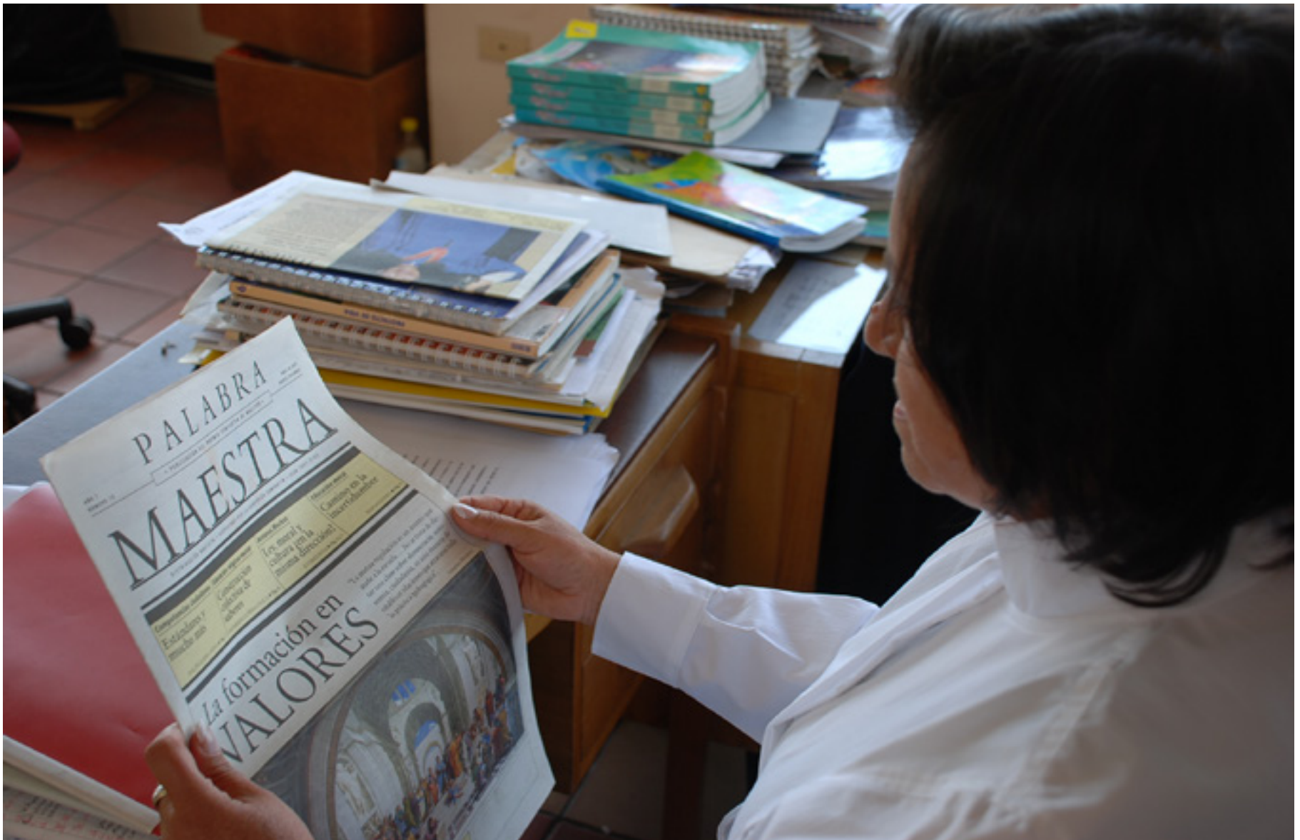
Duitama, 2007