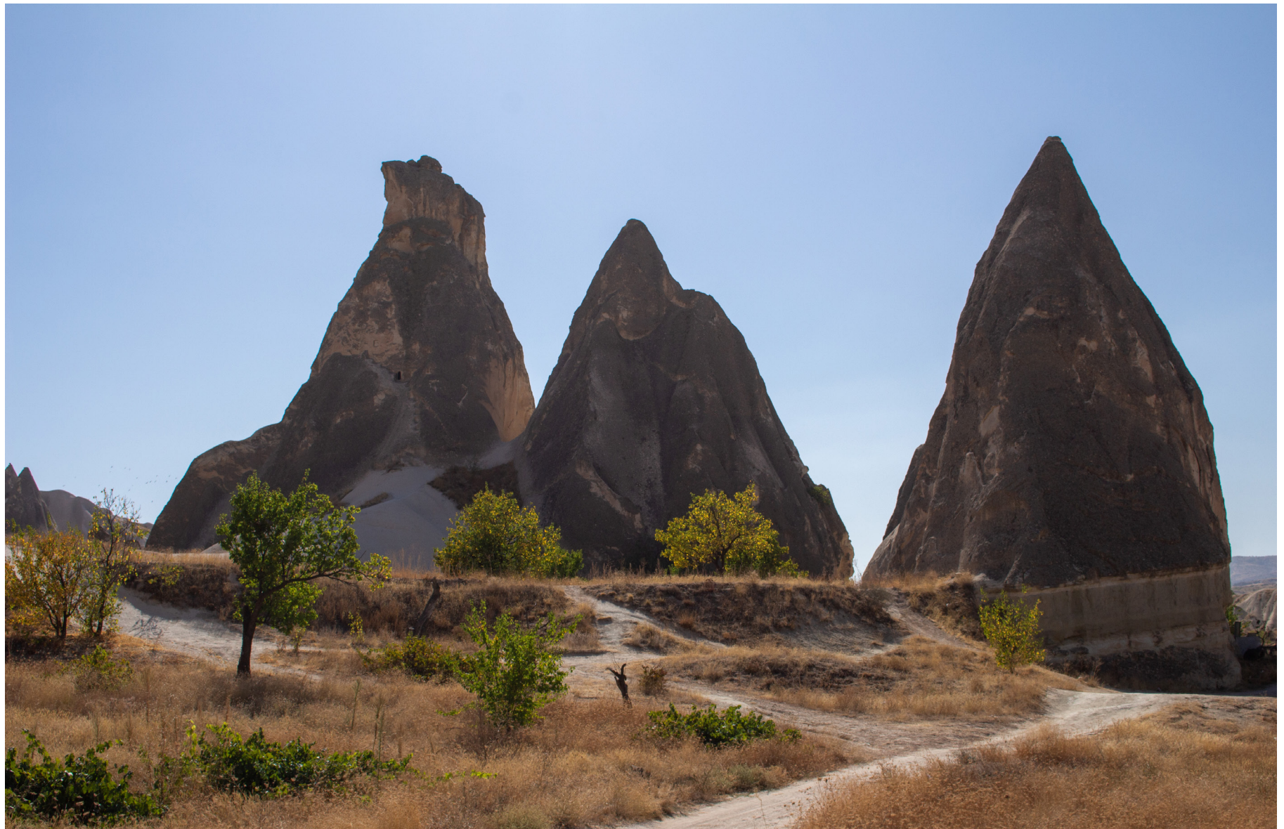
Figura 4: Valle de los Monjes - Göreme, Kapadokya - Turquía