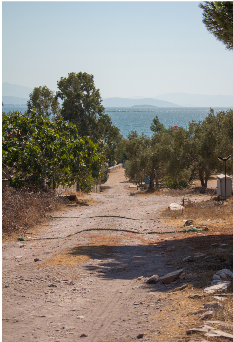
Figura 6: Uno de los caminos de lasos Camping que conduce al Mar Mediterráneo - Kiyikislacik, Milas, Bodrum, Turquía.