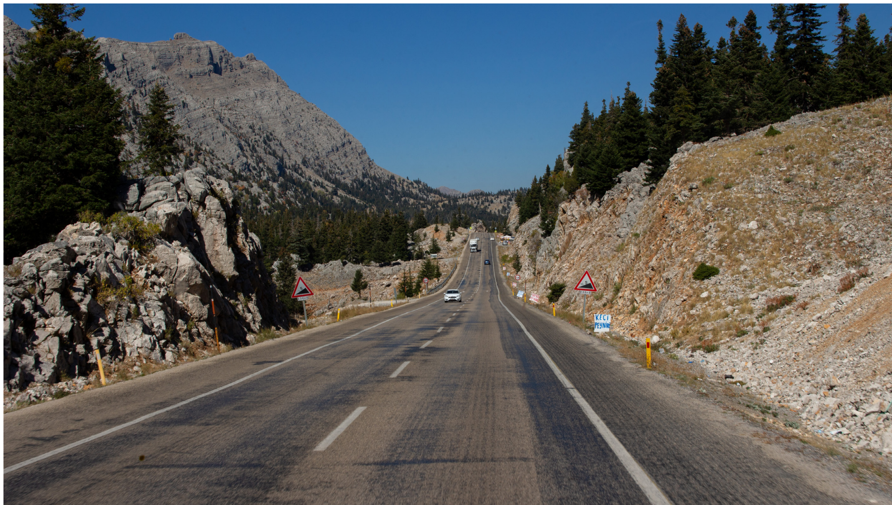
Figura 2: Vía de Antalya a Göreme - Tuquía.