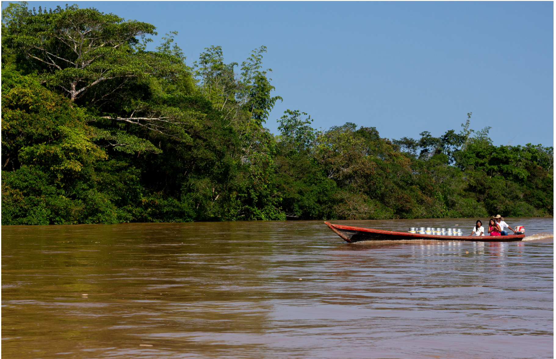
Figura 1: Canoa viaja por el Río Ortegaza transportando dos mujeres indígenas, un en estado de embarzo, y diez tinajas llenas con leche. Milán, Caquetá - Colombia.