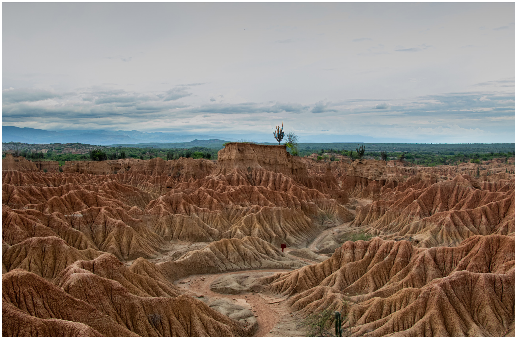
Figura 9: El Cuzco, zona de tonos rojos en el Desierto de la Tatacoa. Es uno de los sitios más visitado de este Bosque seco tropical. Departamento del Huila - Colombia.