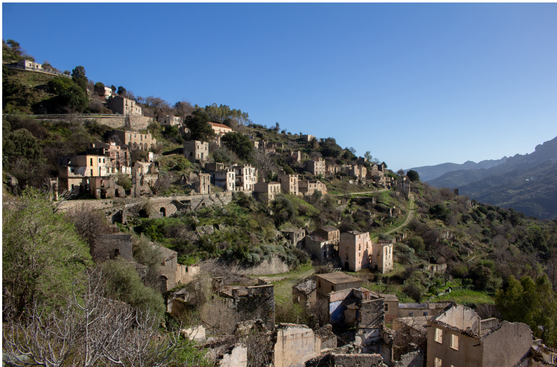
Figura 8: Los caminos del viejo Gairo. Un pequeño pueblo en centro de la Sardegna, que fue destruido por una inundación en 1951 y, posteriormente, 1963 fue completamente abandonado. Italia.