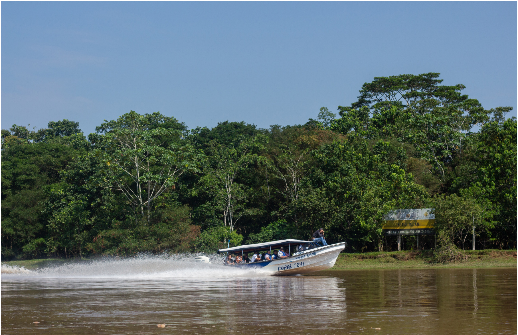
Figura 3: Viaje de retorno- La Tagua, Putumayo a Puerto Arango, Florencia Caquetá. Este es el medio de transporte de los habitantes de la ribera de los río, Orteguzaga, Caquetá y Putumayo.