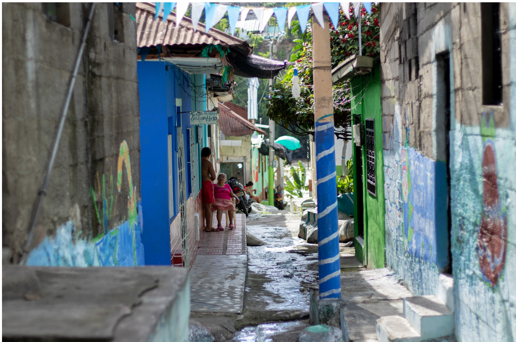
Figura 5: Señora toma el fresco frente a su casa en uno de los Callejones, de la carrerra 3 de Honda, Tolima. Estas pequeñas vías desembocan en el río Magdalena. Honda, Tolima - Colombia.