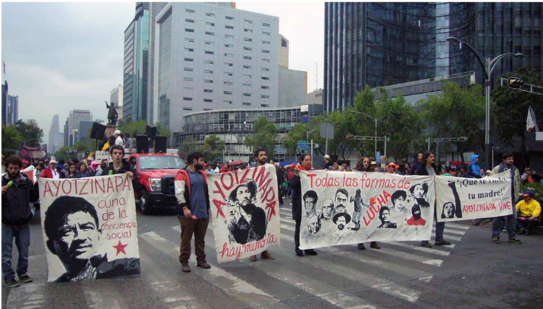
Mantas del Colectivo Híjar (por la memoria histórica) en marcha por Ayotzinapa, Ciudad de México, 17 julio 2017.