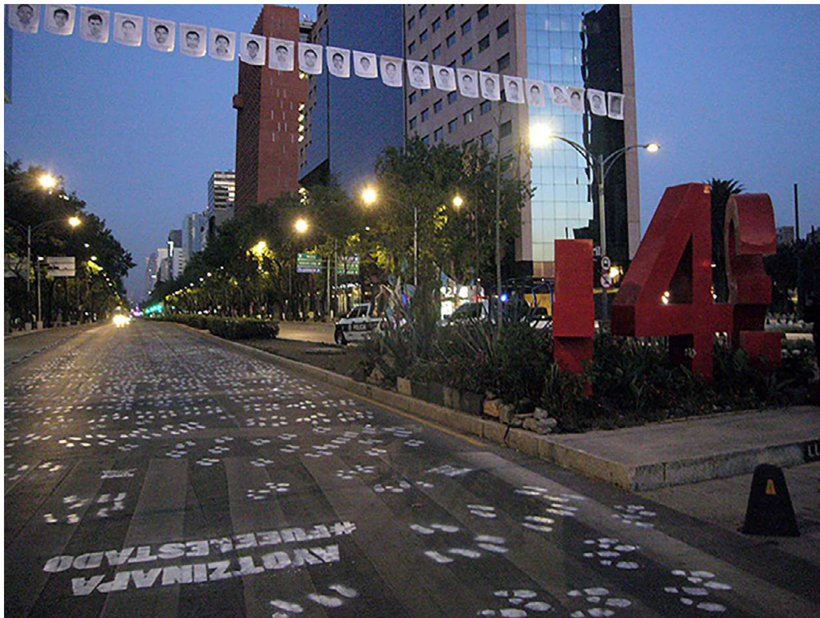
Acción gráfica colectiva y marcha simbólica por Ayotzinapa durante la pandemia. Ciudad de México, 26 mayo 2020.