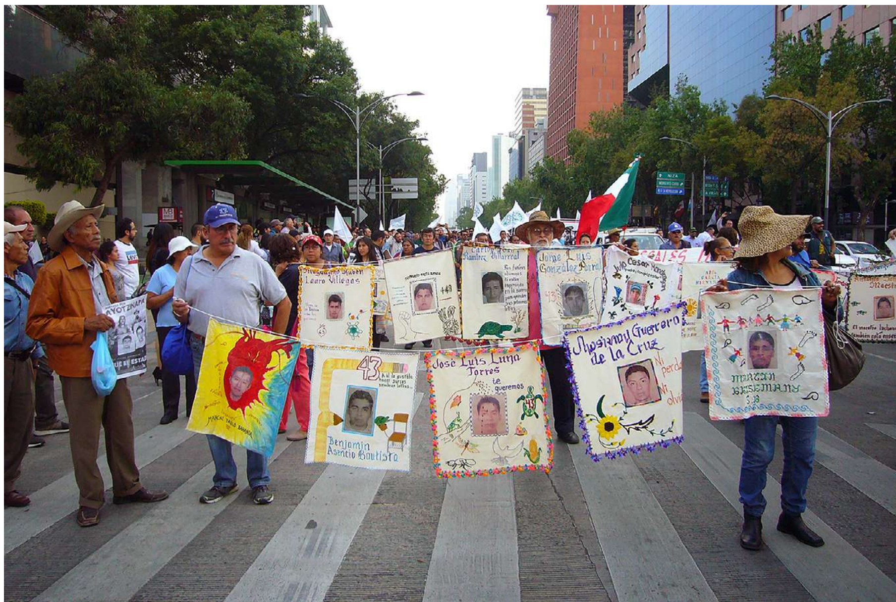
Bordados por los 43 realizados por la Asamblea General de los Pueblos, Barrios, Colonias y Pedregales de Coyoacán, Ciudad de México, marcha mensual por Ayotzinapa, 26 abril 2018.