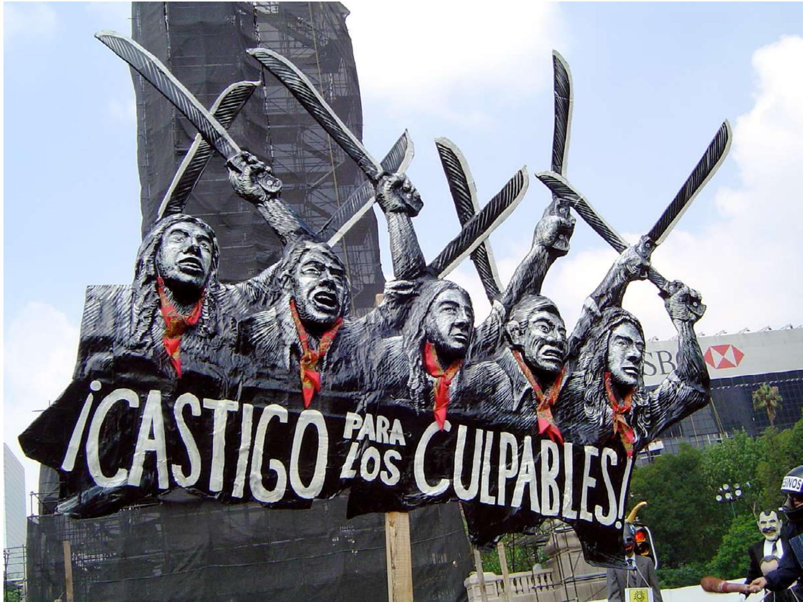
Pancarta tridimensional realizada por el artista visual Rama, portada en marcha contra la represión en Atenco, Estado de México, en la Ciudad de México, 28 mayo 2006.