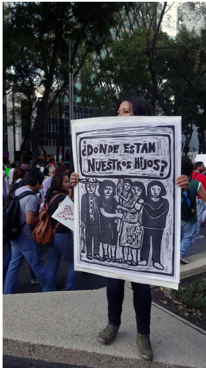
Cartel ¿Dónde están?, impresión comunitaria. Marcha por Ayotzinapa, 8 octubre 2014, Ciudad de México.