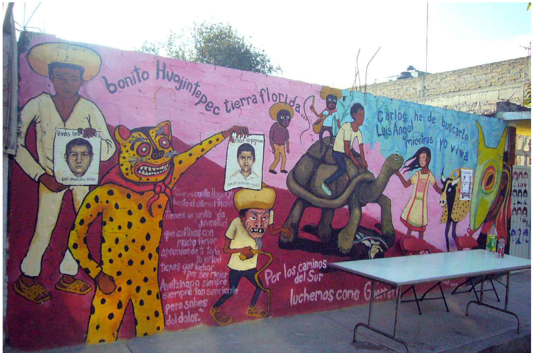
Mural de realización colectiva para Carlos y Luis Ángel, dos de los 43 detenidos-desaparecidos de Ayotzinapa, en casa particular en los Pedregales de Coyoacán, 25 abril 2015.