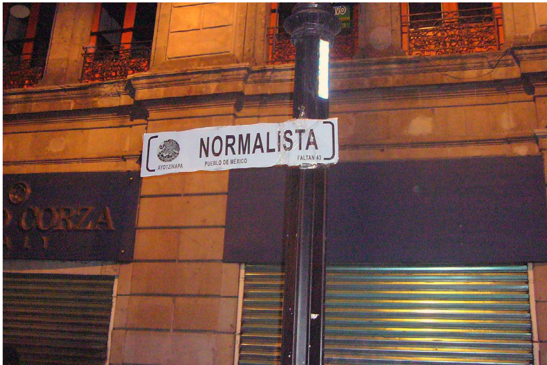
Acción gráfica de renombramiento de calles en el Centro Histórico de la Ciudad de México, 20 noviembre 2014.