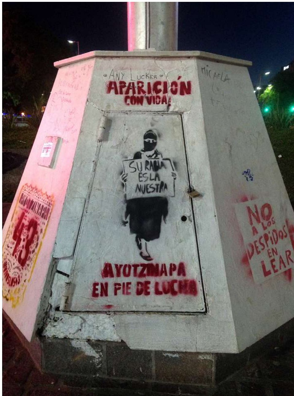
Plantilla por Ayotzinapa en metro Insurgentes, Ciudad de México, 5 noviembre 2014.