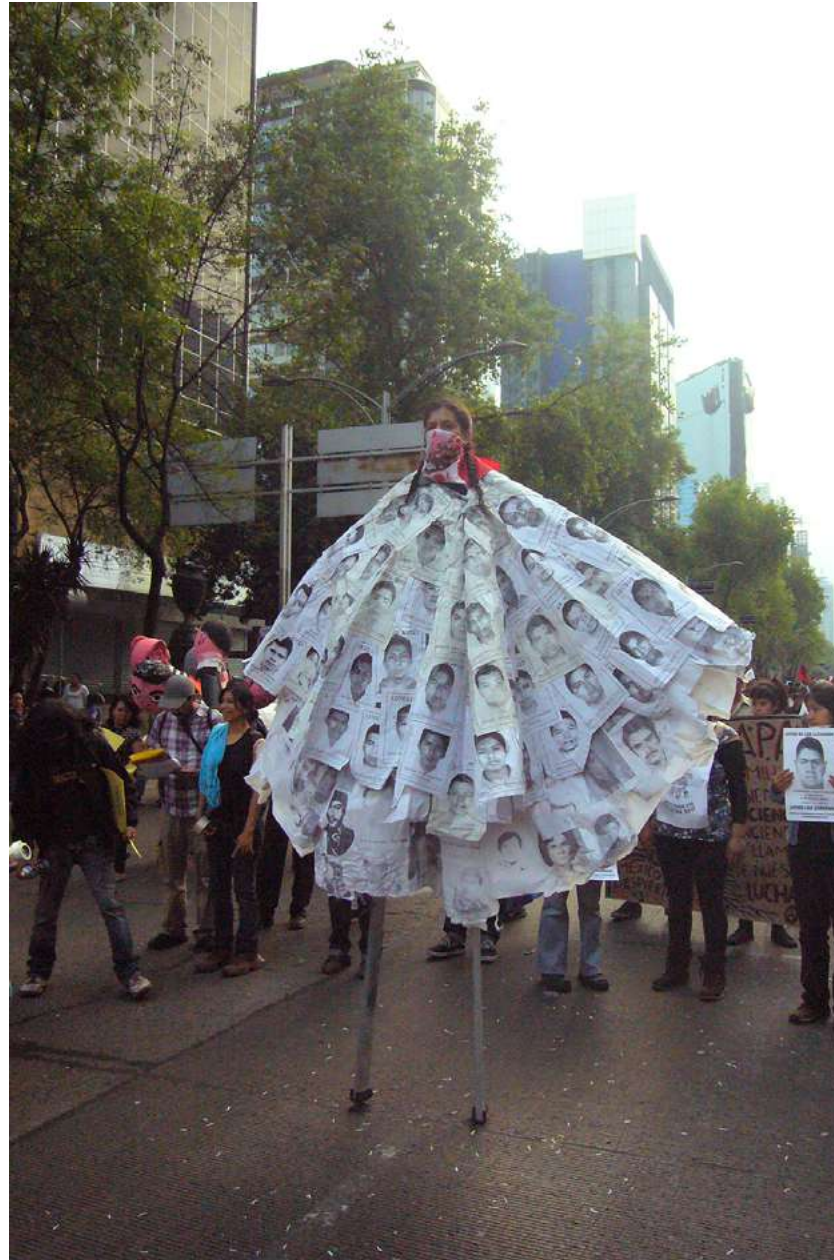
Capa por lxs desaparecidxs del colectivo Chanti Ollin en marcha por Ayotzinapa, 26 enero 2015, Ciudad de México.