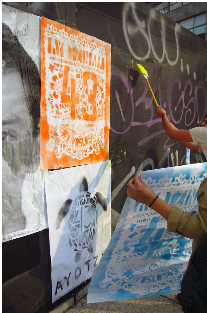
Pega de retratos y carteles durante la Jornada de Acción Global por Ayotzinapa, Paseo de la Reforma, Ciudad de México, 26 abril 2018.