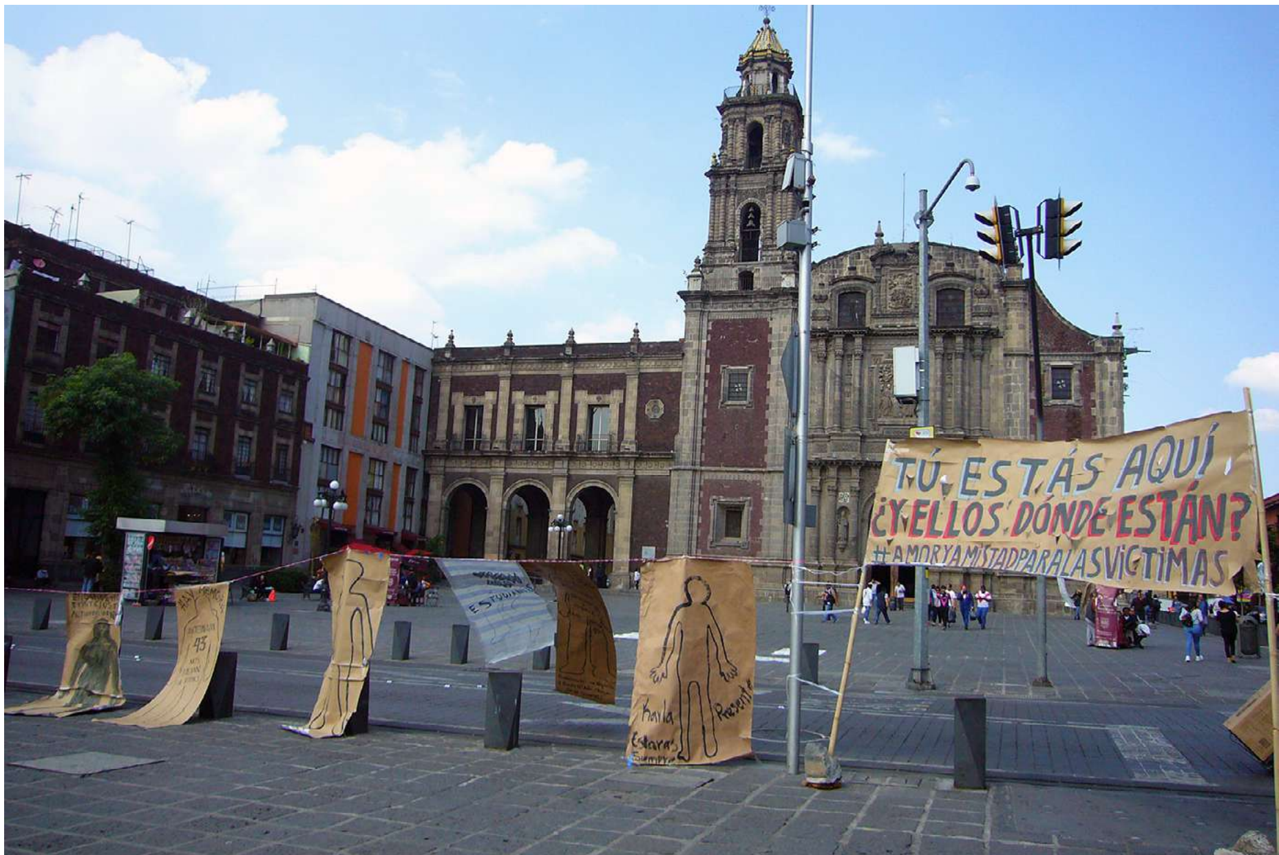
Siluetas por lxs desaparecidxs en la Plaza de Santo Domingo, Ciudad de México, 14 febrero 2018.