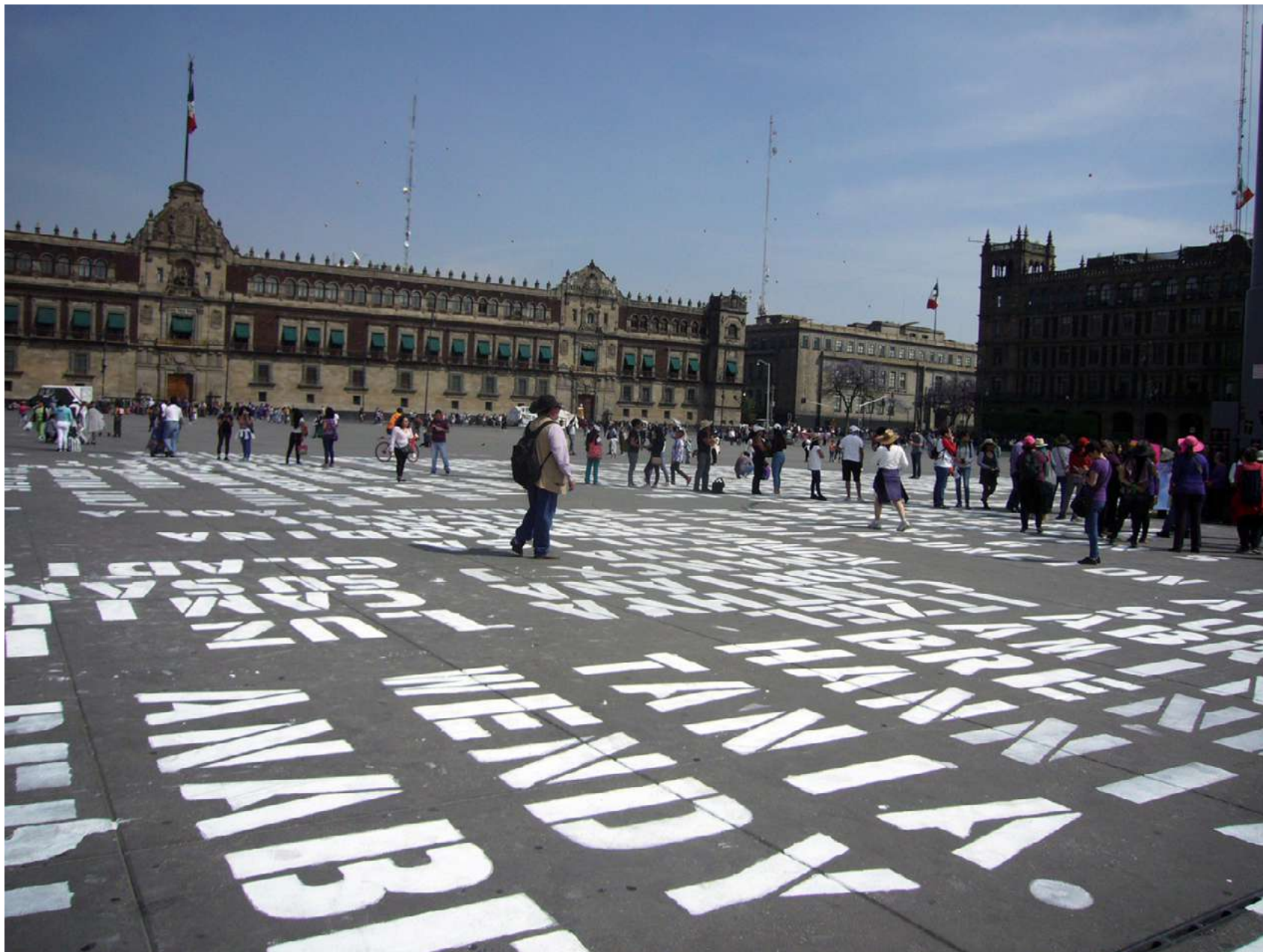
Pinta monumental de colectiva feminista en la plancha del zócalo de la Ciudad de México, con los nombres de víctimas de femicidio, 8 marzo 2020.