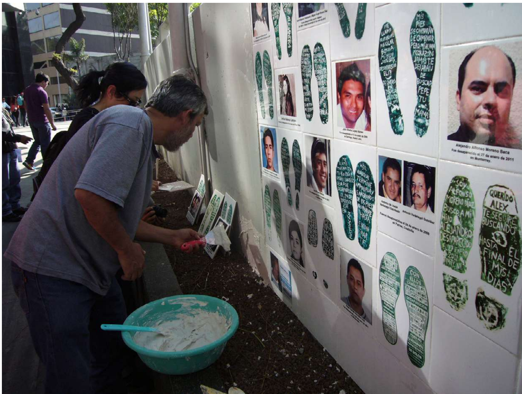
Huellas de la memoria, mural en mosaico en las afueras de la Fiscalía General de la República, Ciudad de México, 24 febrero 2020.