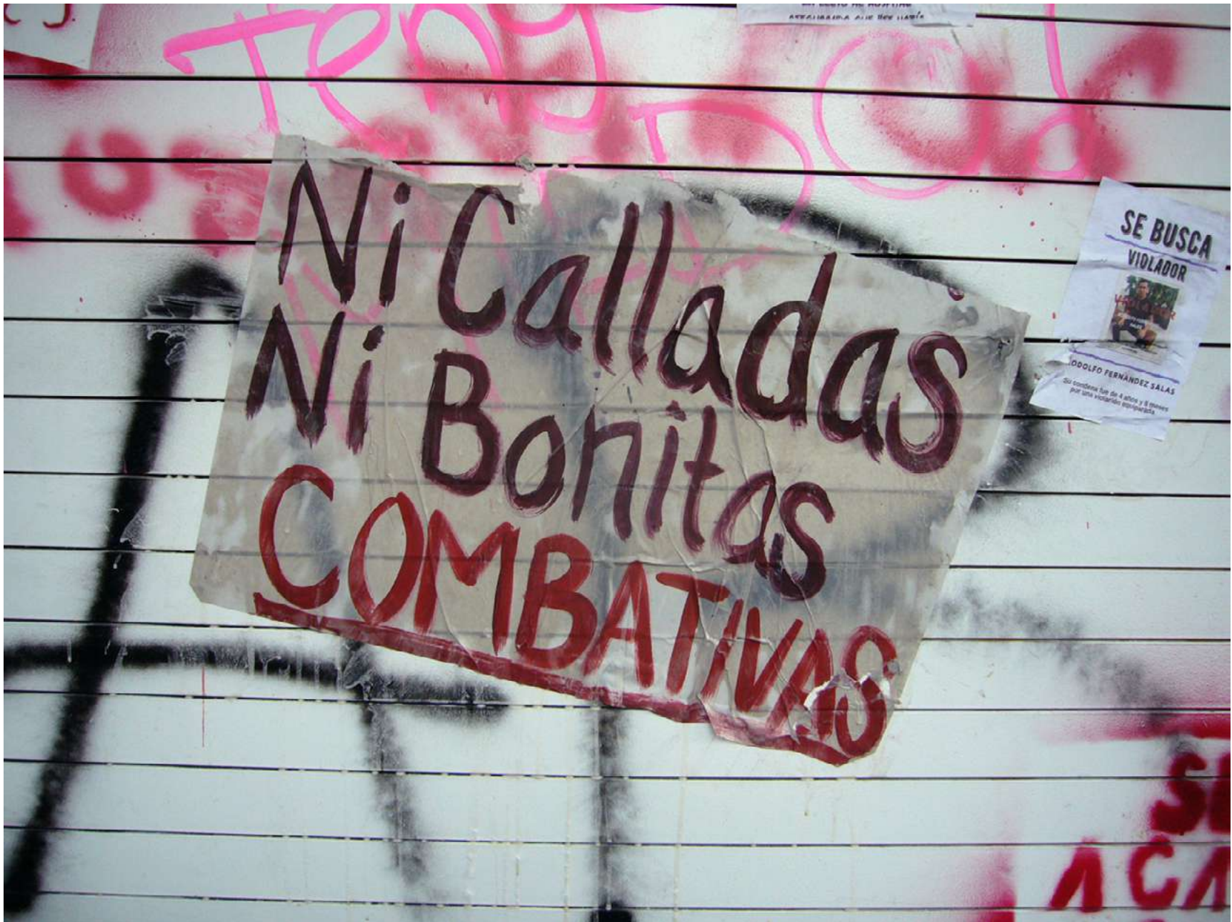
Pega feminista, Ciudad de México, 8 marzo 2020.