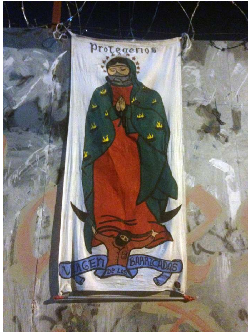
Virgen de las Barricadas en el plantón en defensa del agua en Aztecas 215, Asamblea General de los Pueblos, Barrios, Colonias y Pedregales de Coyoacán, Ciudad de México, 22 diciembre 2017.