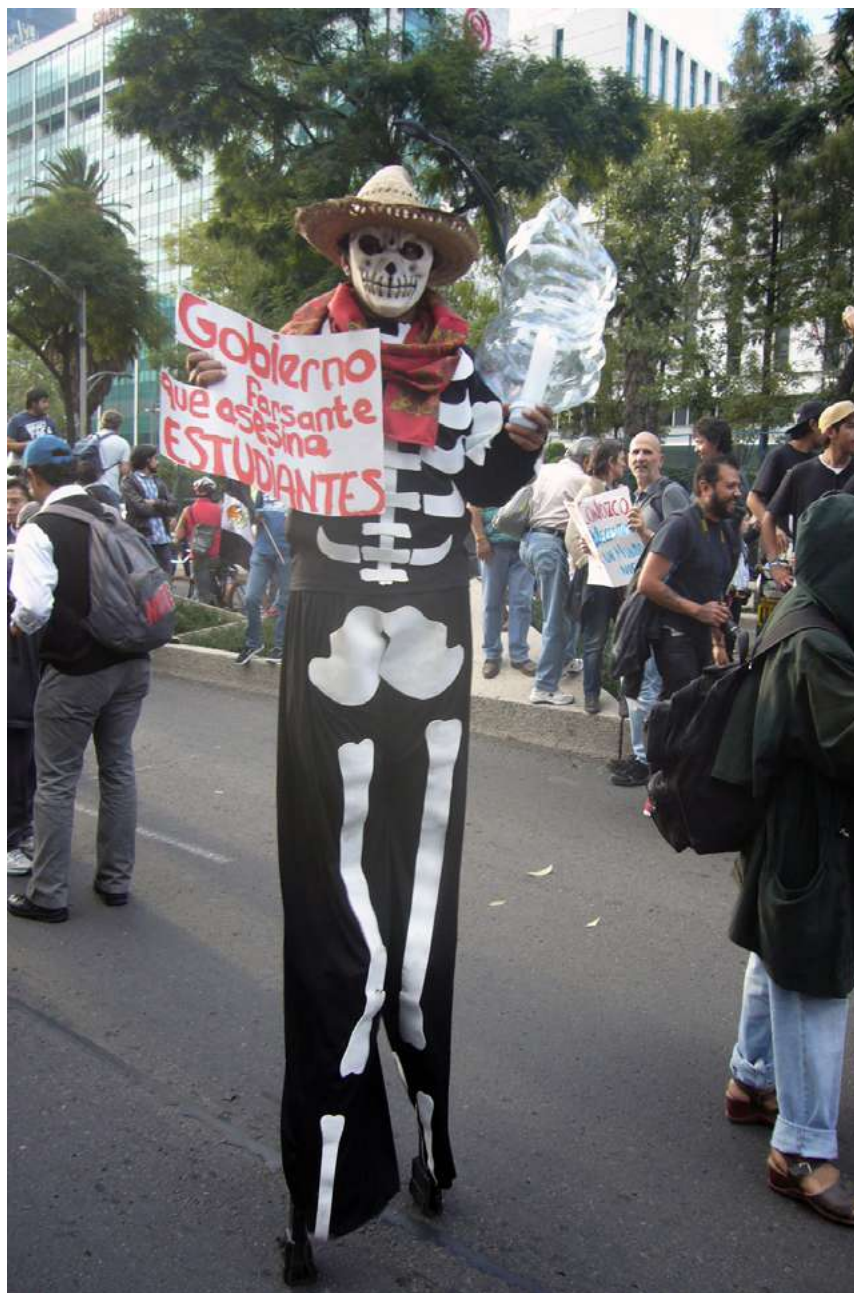
Manifestante en zancos. Marcha por Ayotzinapa, 22 octubre 2014.