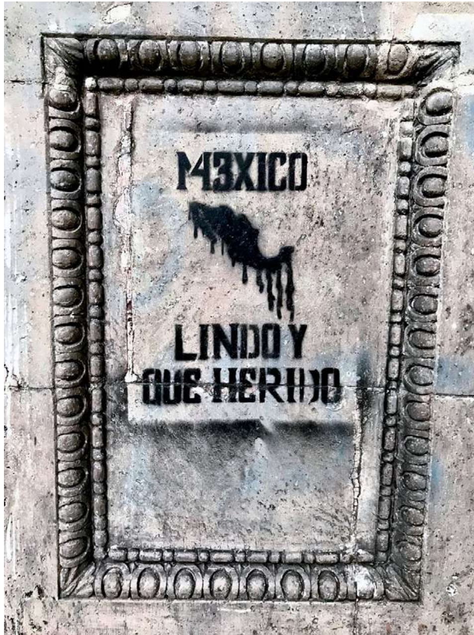
Esténcil colocado en base de estatua sobre Paseo de la Reforma, Ciudad de México, 6 febrero 2020.