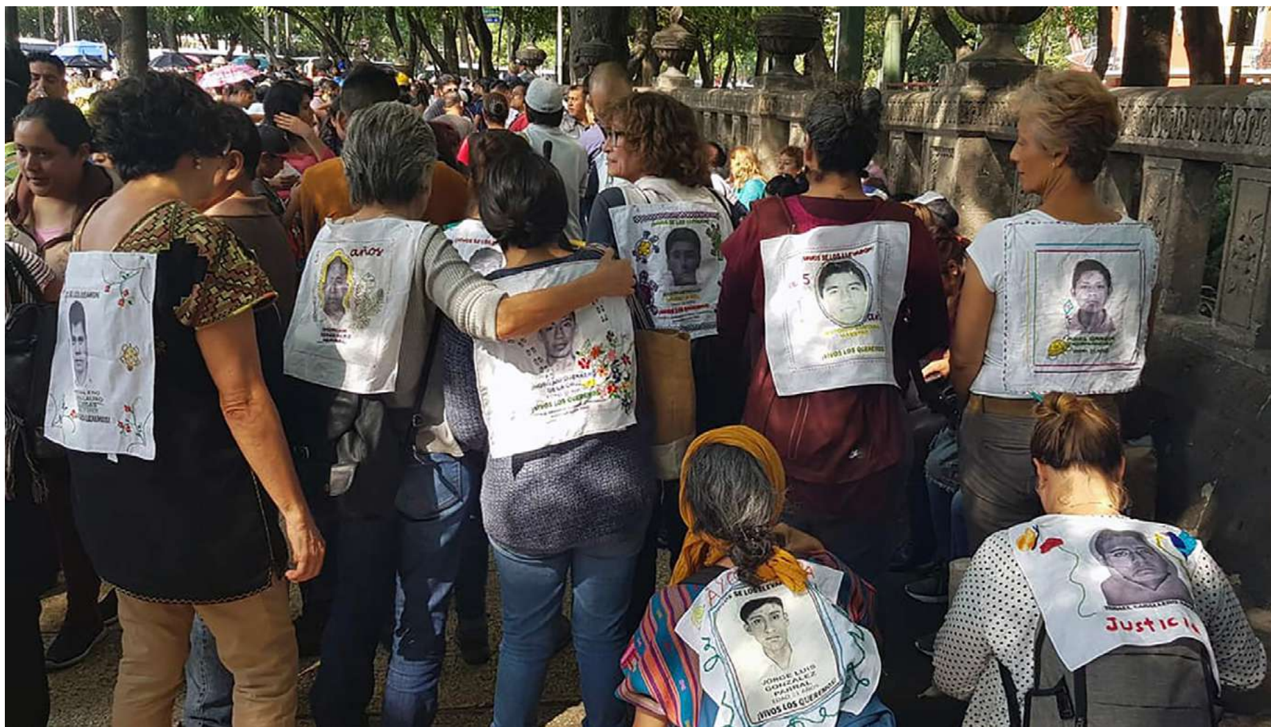
Bordando por la Paz y la Memoria: una víctima, un pañuelo en marcha por el 5º aniversario de Ayotzinapa, Ciudad de México, 26 septiembre 2019.