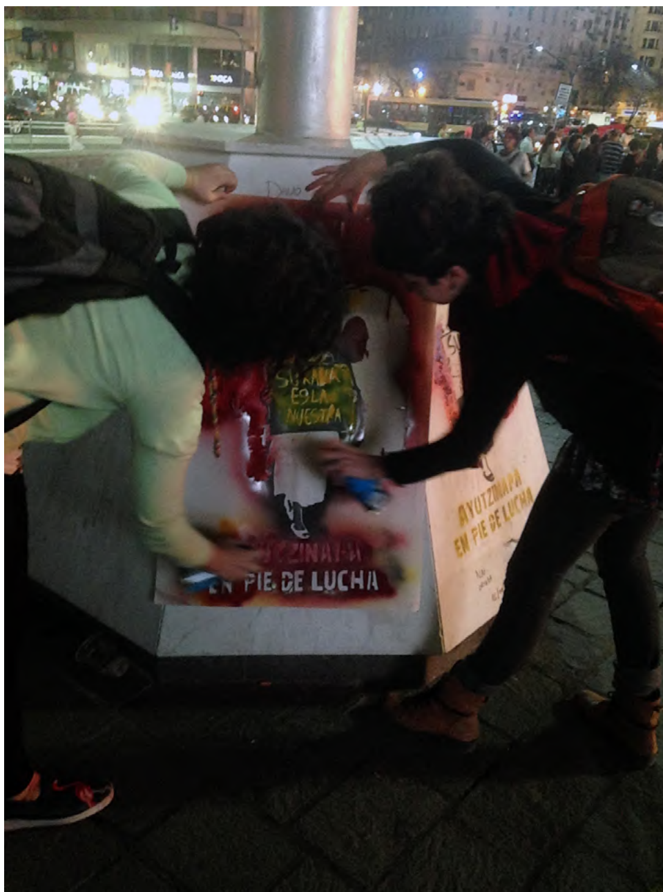
Plantilla por Ayotzinapa en metro Insurgentes, Ciudad de México, 5 noviembre 2014.