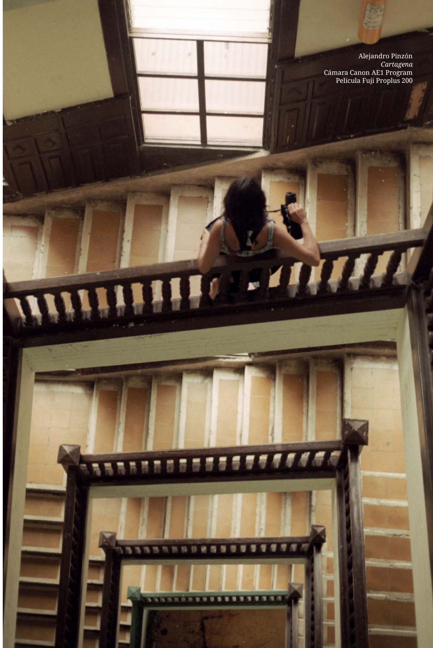
Alejandro Pinzón Cartagena Cámara Canon AE1 Program Película Fuji Proplus 200