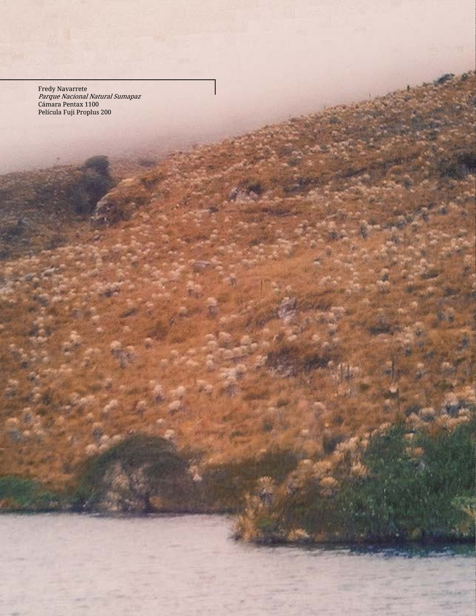
Fredy Navarrete Parque Nacional Natural Sumapaz Cámara Pentax 1100 Película Fuji Proplus 200