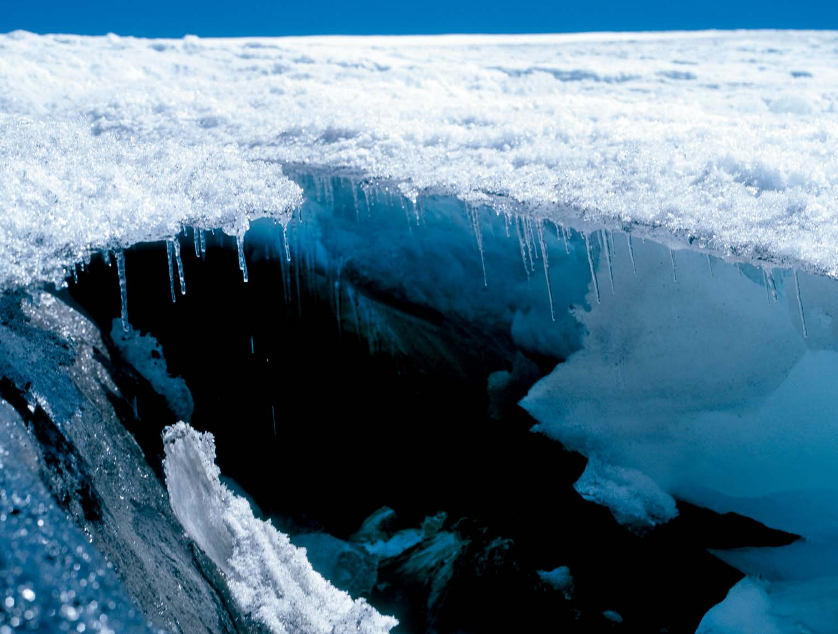
Juan Carlos Murcia Sierra Nevada del Cocuy y Güican Cámara Mamiya 645 Película Kodak E100VS