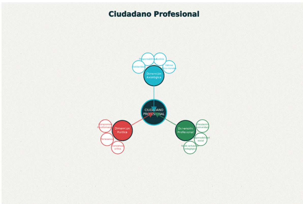
Figura 1 Esquema conceptual de la categoría ciudadano profesional Elaboración propia

Nota: esquema conceptual de la categoría ciudadano profesional en la Licenciatura en Educación Primaria