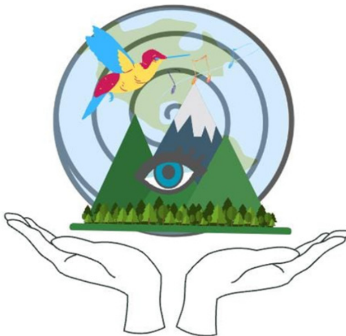
Figura 2. Indicios de la contemplación

Las montañas también son fundamentales para el nacimiento del agua. Desde ellas brotan cristalinas y puras fuentes, las cuales se convertirán en ríos, a los que protegen de su contaminación no solo física, sino también espiritual. Bukunkuzo es la montaña sagrada, “la de las mejillas plateadas”, como la describe Víctor Arias. De ella nacen más de setenta ríos, que fluyen desde arriba hacia abajo, abriendo caminos y manteniéndolos para que la vida exista y sea, como don de la montaña para los valles. La neblina que cubre la cima del Bukunkuzo reafirma la vinculación de la tierra con el cielo, donde la manifestación del agua en uno de sus estados físicos materializa tal relación (Campuzano, 2019). Las montañas son su territorio, su origen, su pasado, su presente, su devenir, su comunicación cósmica con la Madre Tierra.