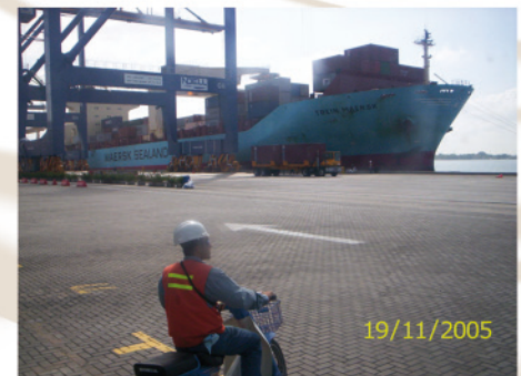
8. Descarga de mercancía en puerto utilizando grúas portico