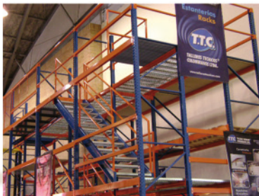
7. Aparejo de racks o estantería para almacenamiento