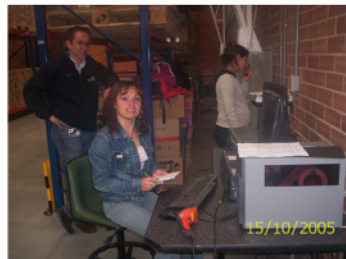
4. Registro de información de mercancía. Una de las actividades que se realizan frecuentemente