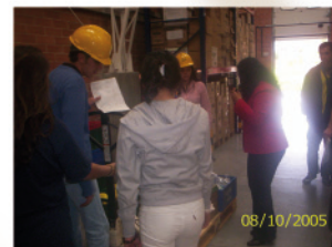
12. En la bodega se alistamos los pedidos para los clientes