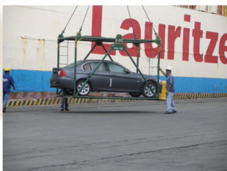
9. Vehículo descargado de buque carguero