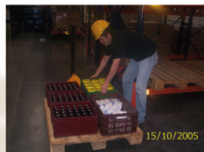
11. Estibado de mercancía