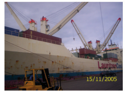
2. Descargue de containers