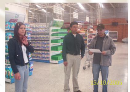
16. Visita IAC