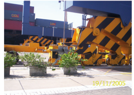
5. Componentes de Grúa portico