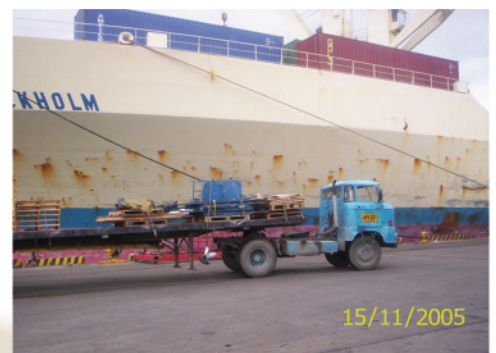
10. Subtransporte (Transporte multimodal)