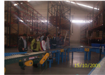
6. Herramientas y equipos almacenamiento de mercancía. (Banda transportadora y Estantería)