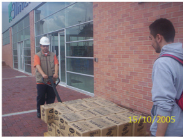
1. Mercancía en muelle de descarga