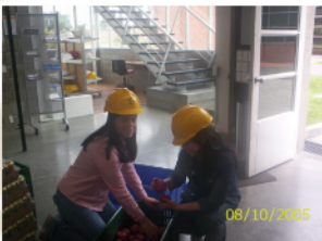
10. Alistamiento de productos perecederos