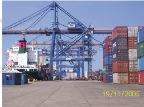
4. Grúas, Barco carguero y almacenamiento de containers