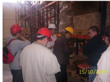
8. Simulación de ubicación y colocación de mercancía en la estantería de almacenamiento. Bodega IAC