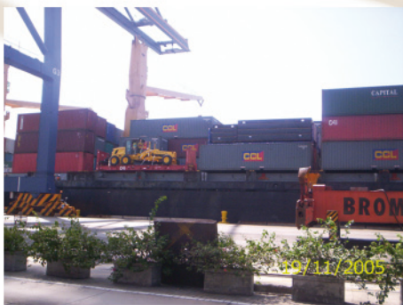
6. Vista de container y operación de descargue en puerto