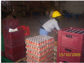
3. Mercancía para almacenamiento ya clasificada y organizada