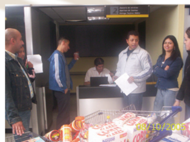
15. El mercado de los clientes