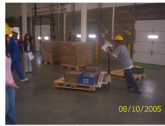
5. La mercancía llega y debe ser clasificada y transportada al lugar donde será ubicada en bodega o sitio de exposición en el almacén