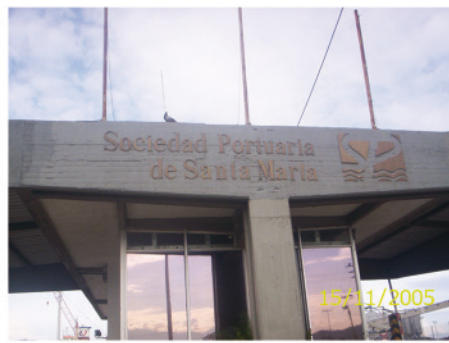
1. Puerto de Santamaría