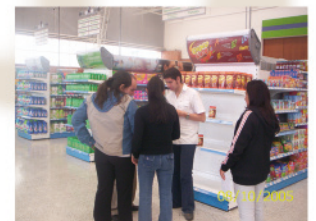
13. Surtido en la góndola