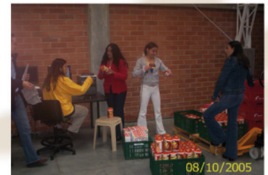
9. Etiquetado y remarcado de mercancía antes de salir al punto de venta