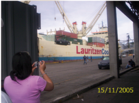
3. Buque, donde se aprecie el descargue de un vehículo