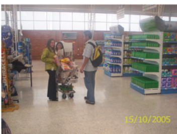
14. Punto de simulación en IAC, Minimercado