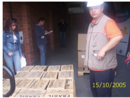
2. Recibo de mercancía