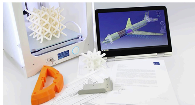
Figura 1. Interfaz CAD y CAM [11].

El CAD involucra la tecnología con el uso de las computadoras para realizar tareas de creación, modificación, análisis y optimización de un diseño. De esta forma, cualquier aplicación que incluya una interfaz gráfica y realice alguna tarea de ingeniería se considera software de CAD [10]. Las tecnologías de CAD abarcan desde herramientas de modelado geométrico hasta aplicaciones a medida para el análisis u optimización de un producto específico. El CAE se refiere a las tareas de análisis, evaluación, simulación y optimización desarrolladas a lo largo del ciclo de vida del producto. El término CAM se puede definir como el uso de herramientas para la planificación, gestión y control de las operaciones de un proceso productivo mediante una interfaz entre un software y los recursos de producción (Fig. 1).