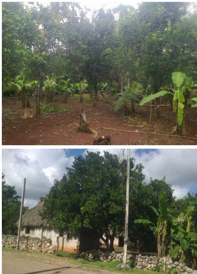
Figura 5 y 6. Solar / Fachada de una casa junto al solar con albarrada de piedra