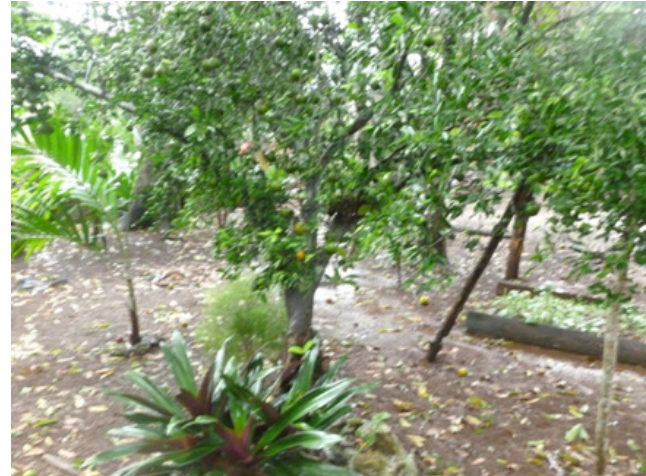
Figura 3 y 4. Solar en José María Morelos, Quintana Roo

a los servicios ambientales, como se muestra en la figura 3 y 4, son excelentes en la composición paisajista local, con vegetación selva media.