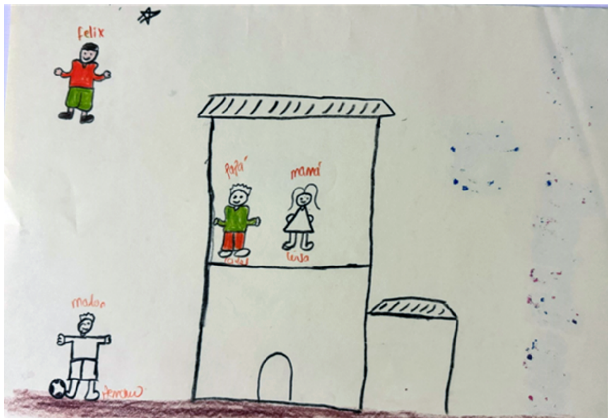
Figura 1. Familia nuclear (2024)

A continuación, se muestran algunos dibujos realizados por los 35 niños y niñas que participaron en la investigación, pertenecientes a los asentamientos humanos informales Los Cacaos y Nuevo Amanecer. En ellos retratan a las personas que conforman sus familias.