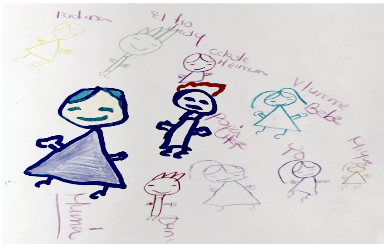
Figura 2. Familia extensa (2024)