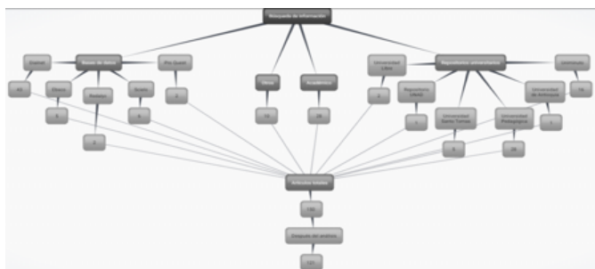
Figura. 1 Revisión bibliográfica