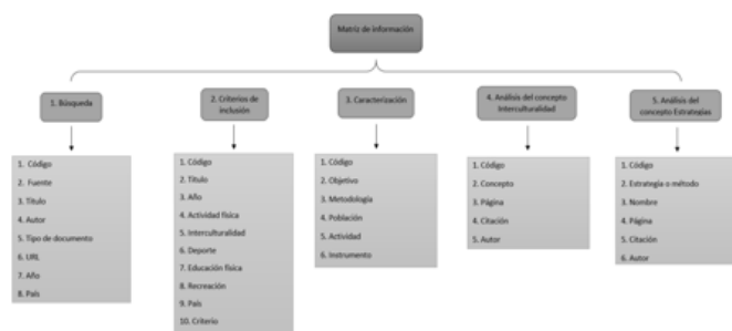
Figura. 2 Flujograma de la matriz de información

Una vez aplicado el proceso de filtrado de la información quedaron 121 documentos, los cuales pasaron a la siguiente hoja de la matriz denominada "Caracterización" donde se identifica el objetivo, metodología, población, actividad e instrumento utilizado en cada investigación. Luego al caracterizar cada documento se establecen dos categorías principales que se quieren identificar, la percepción de interculturalidad y las estrategias aplicadas. Una vez establecidas