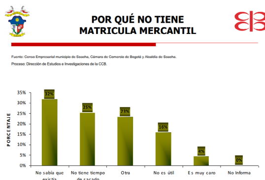
Figura 2. Censo empresarial municipio de Soacha